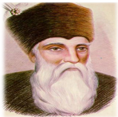
Școala Gimnazială "Miron Costin" Bacău